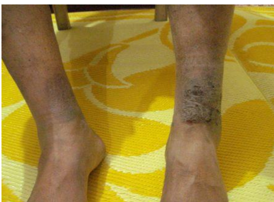
Photograph taken on 08/07/2012